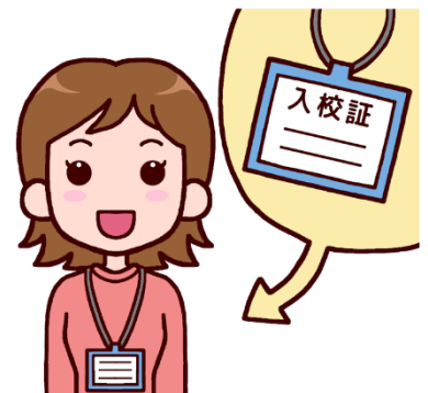
会員証などカード類 (3000 円/カード 10 枚～)