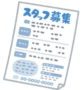
広告 (3000 円/ページ～)