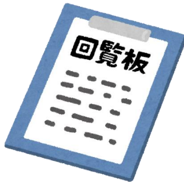
回覧板 (500 円/ページ～)