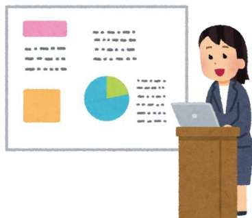
プレゼン資料 (5000 円/ページ～)