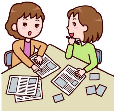
広報誌 (3000 円/ページ～)