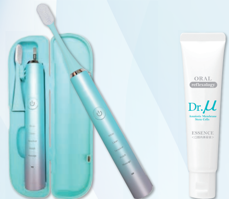
口腔内美容機器(収納ケース付)