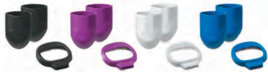
ブラック パープル ホワイト スカイブルー

ウェルチ・アレン ポケットLED用アクセサリキット(ハンドルバンパー、ウィンドウバンパー)