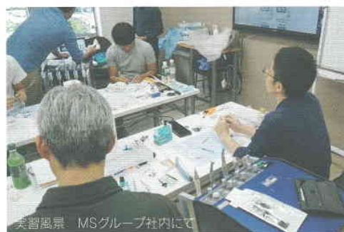
実習風景 MSグループ社内にて