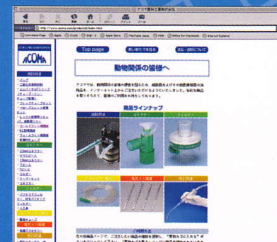
ON LINE TOPページ