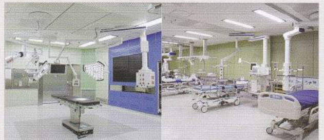
【名古屋シミュレーションセンター】愛知県西春日井郡豊山町豊場中道 6-1

当グループでは名古屋市郊外にシミュレーションセンターを整備しております。内部は手術室ゾーン・集中治療部ゾーン・医療ガス設備ゾーンに分かれ、実物の機器や設備を使って体験・検証が可能です。