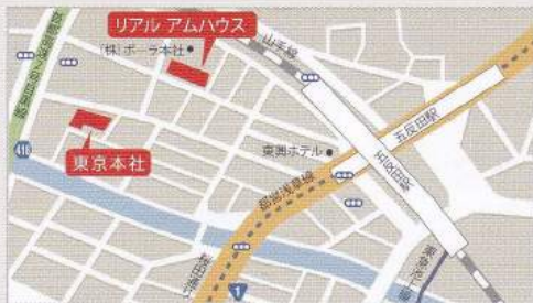
【リアルアムハウス】東京都品川区西五反田 2-2-10

AMhouse をご覧いただけるショールームを東京都品川区に開設しております。AMhouse を見て触っていただくことで、新しい手術室のカタチを実感してください。是非お気軽にお越しください。