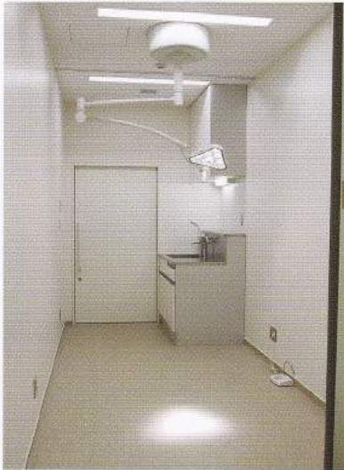
: デネブ LED 3500C (シーリング)