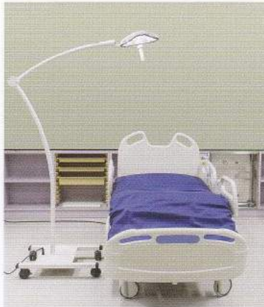
: デネブ LED 3500S (可動式スタンドシステム)