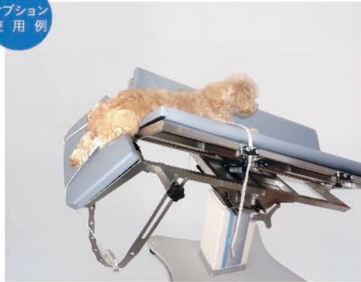
ドレープアーチは四肢を固定することにも 使用できます。