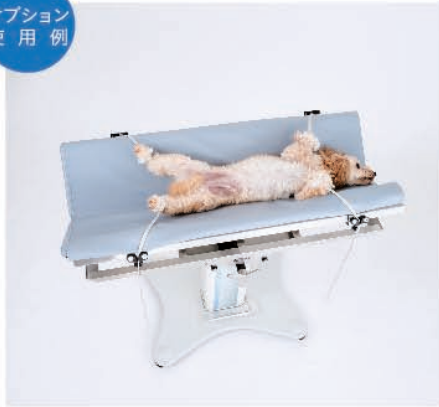
V型天板にOPマット大を敷いて 動物を固定