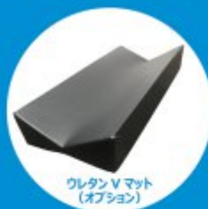
ウレタンVマット (オプション)