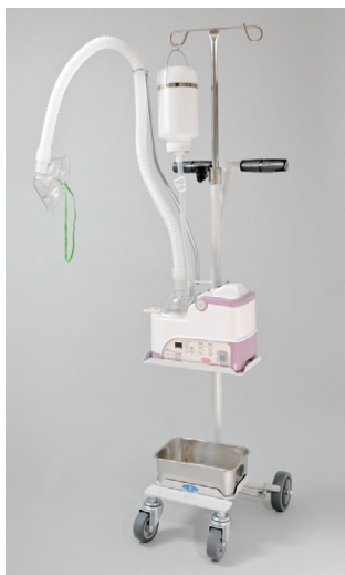
本体・薬液連続瓶・蛇管・マスクは別売