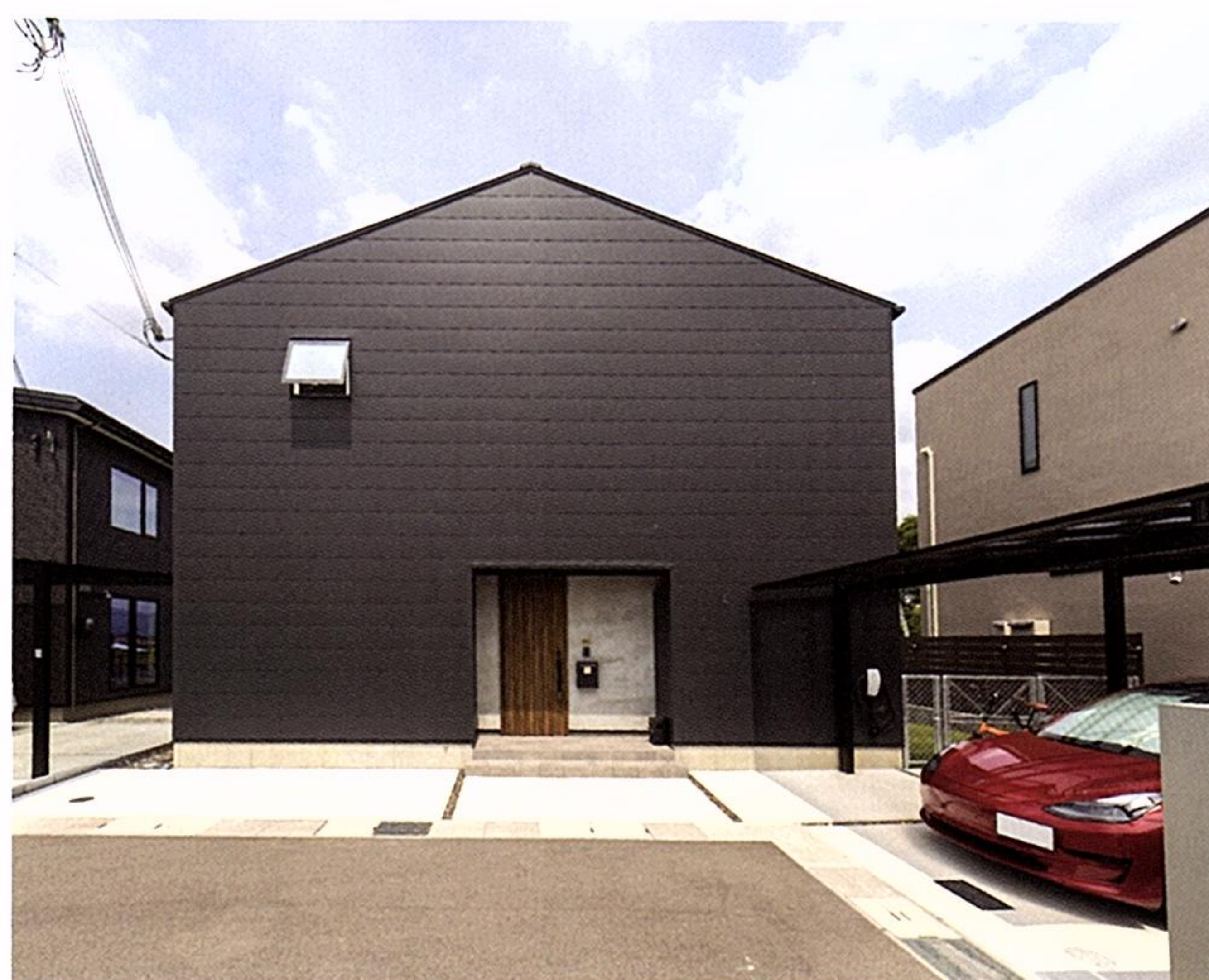
ガルバリウム鋼板の外壁と三角屋根にこだわったという外観。夏の陽射しが室内に入るのを避けるため、2階のランドリールーム以外は西側に窓を配置していない。

家づくりを考え始めたのは、ご主人の仕事がコロナ禍を経てリモート中心となり、家で過ごす時間が増えたことがきっかけでした。地元工務店の中から、サエラ暮らし研究所を選んだ決め手となったのは、自然素材の知識も実績も豊富だったことだと言います。「私自身、子どもの頃にアトピー性皮膚炎で悩んでいたのですが、家を自然素材で建て替えて、症状が改善した経験が