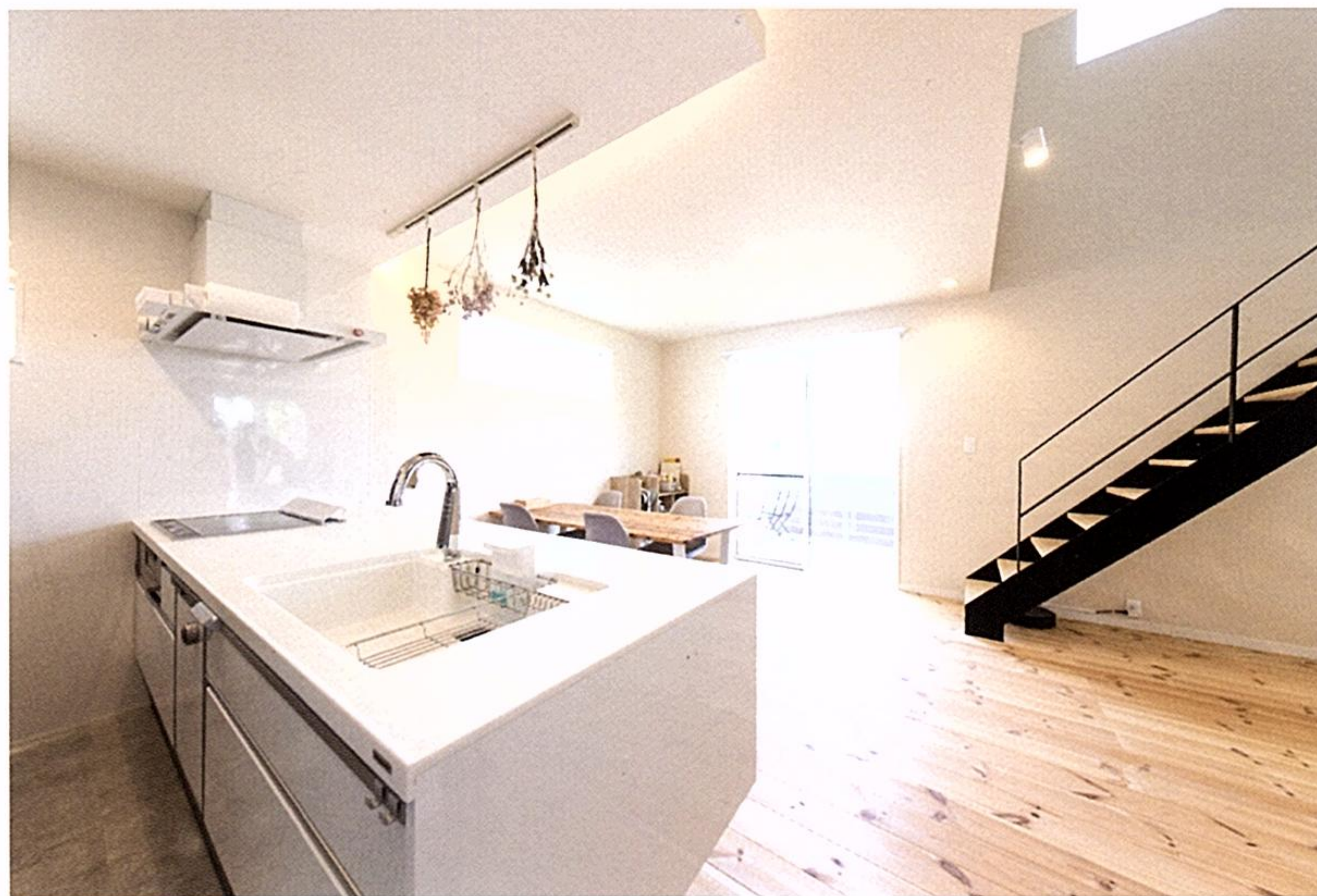
ダイニングとの一体感もあるペニンシュラ型のキッチンは、ご主人も「家の中で気に入っている場所の一つ」と話す。