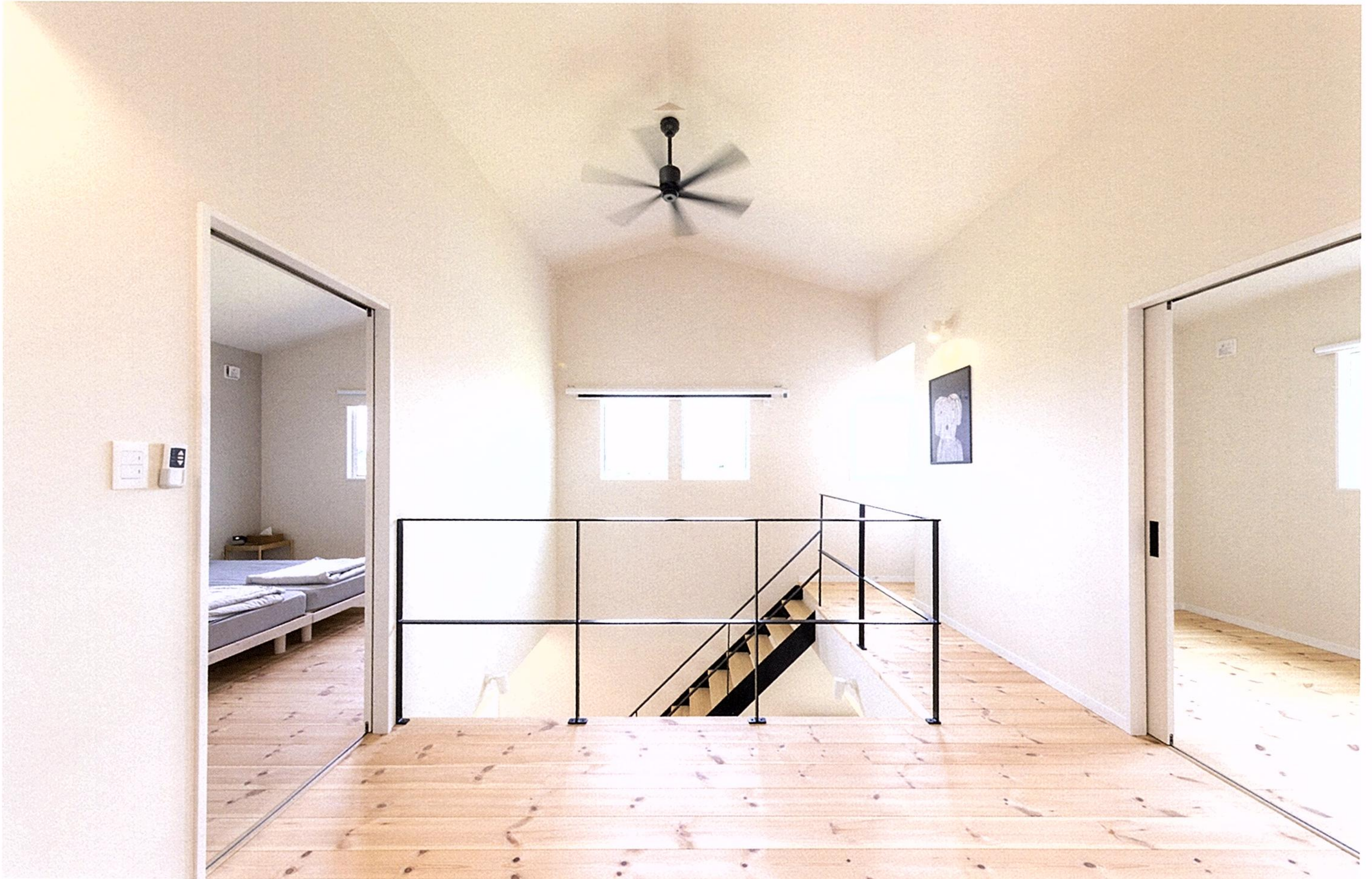
パイン材の床でそろえて統一感を出した、2階のホール。東向き窓の高さもそろえたことで、個室の扉を開けると、大きな一つの空間のように広々と感じることができる。