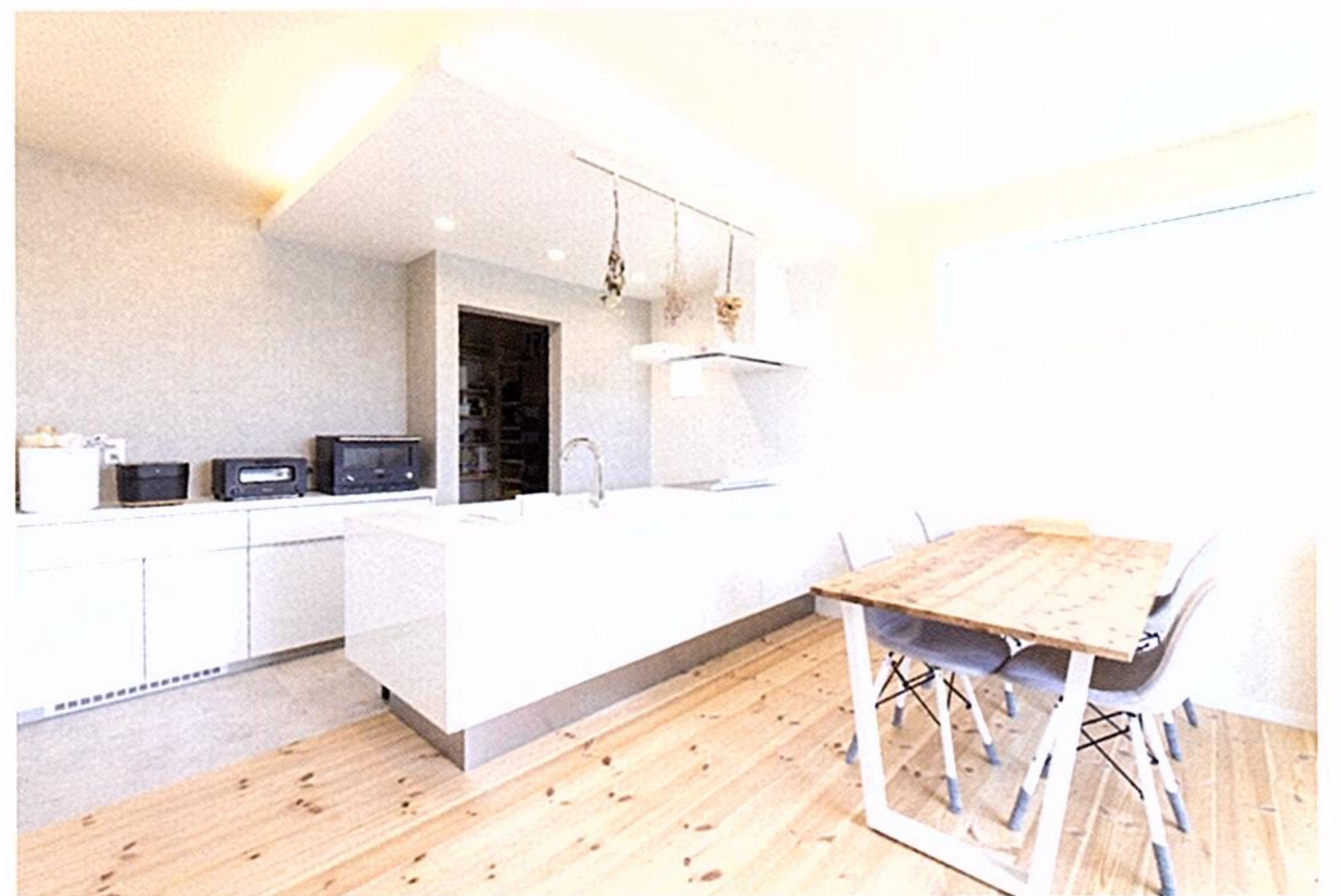
「なるべく生活感を出したくなかった」というキッチンには、吊り戸棚も付けずスッキリとさせ、天井の間接照明が光を演出。ダイニング側の窓は隣家の視線を避けるため、高い位置に配置。