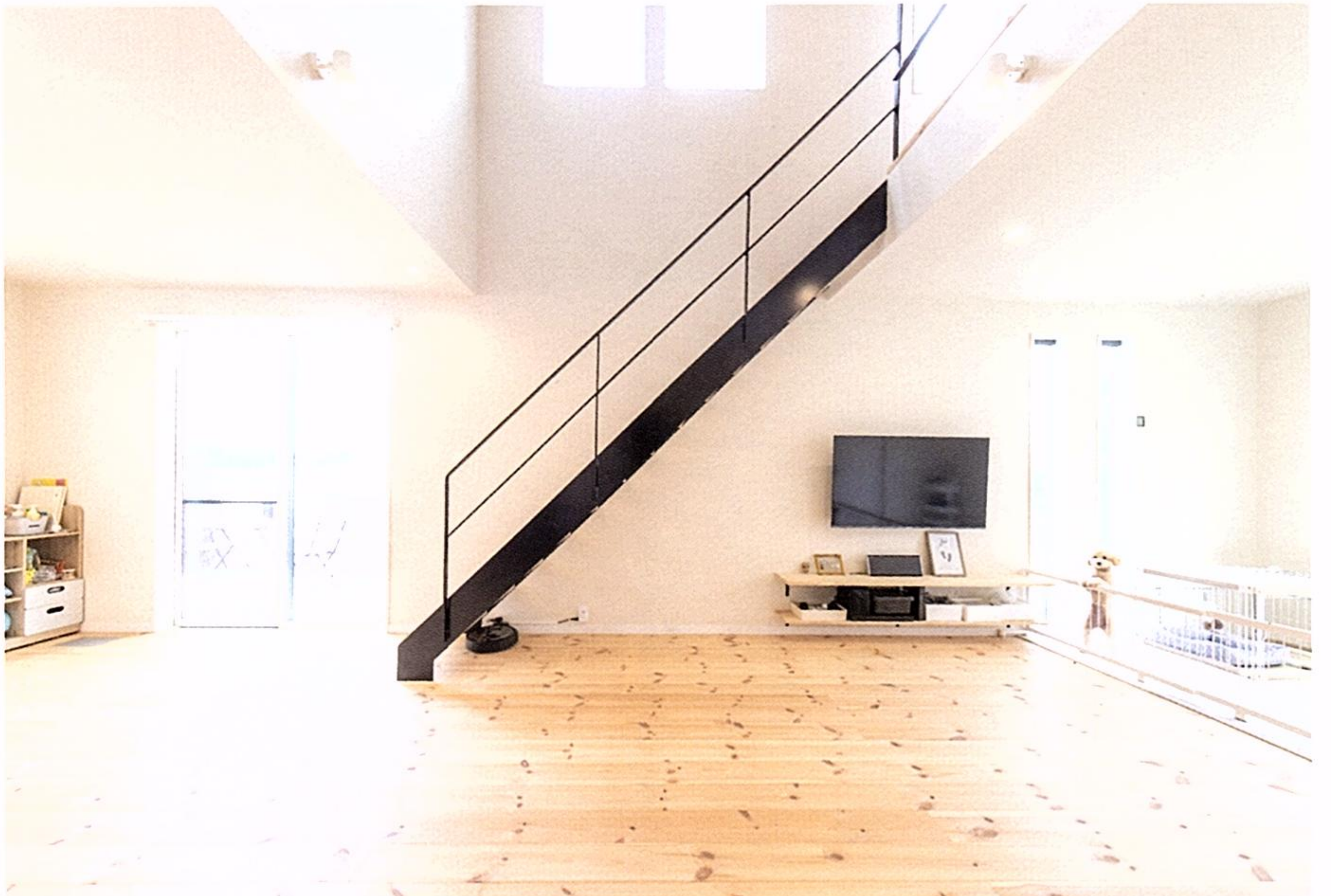
目の前に建物がなく、開放的な景色が楽しめる東向きの壁には、タイルデッキにつながる大きな窓や、縦長のスリット窓を。庭側にはフェンスとマットを設置し、ペットが遊べるコーナーに。