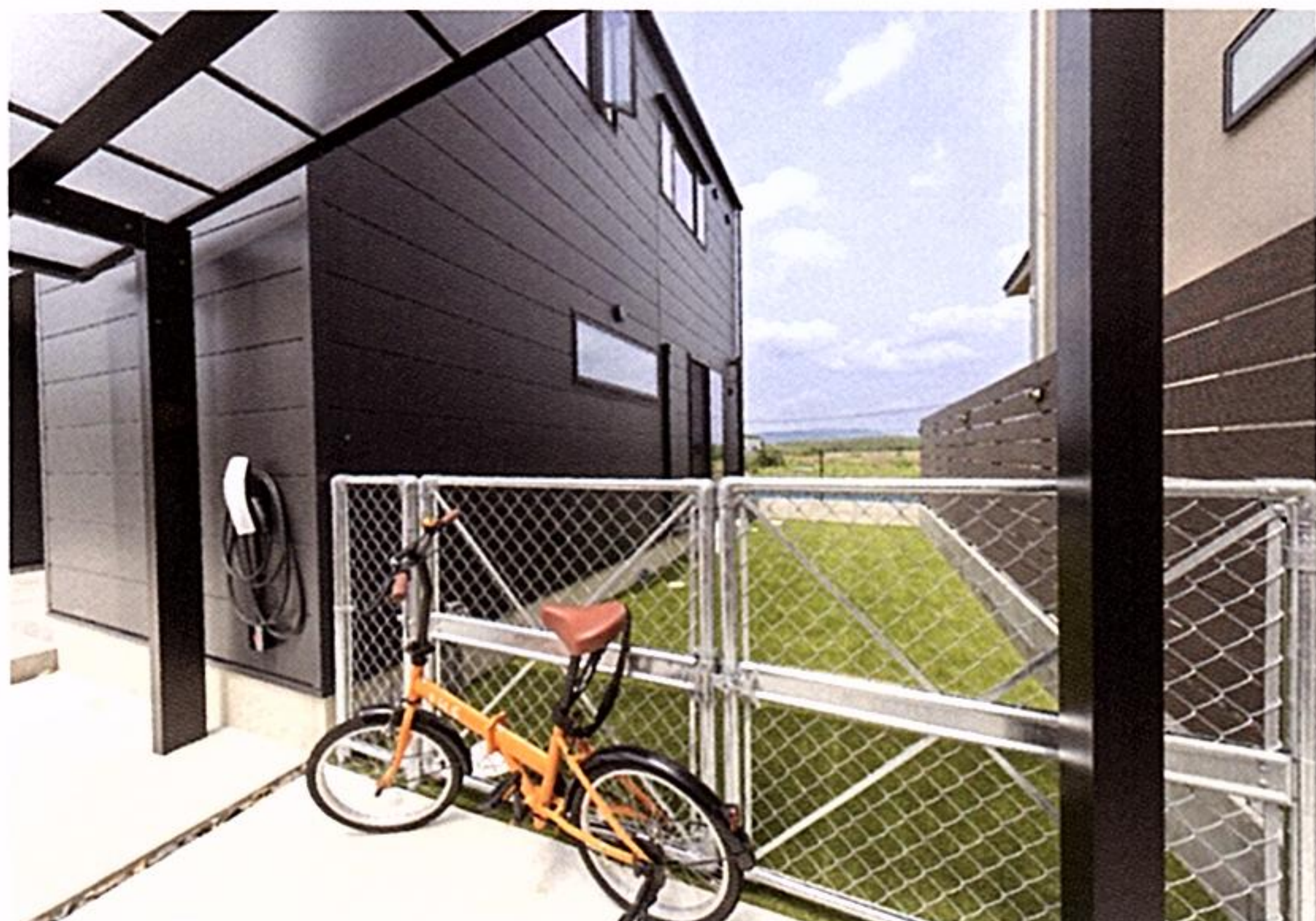
ドッグランも兼ねた芝生の庭の入口は、ご主人が見つけたというスチール材のアメリカンフェンスを設置。