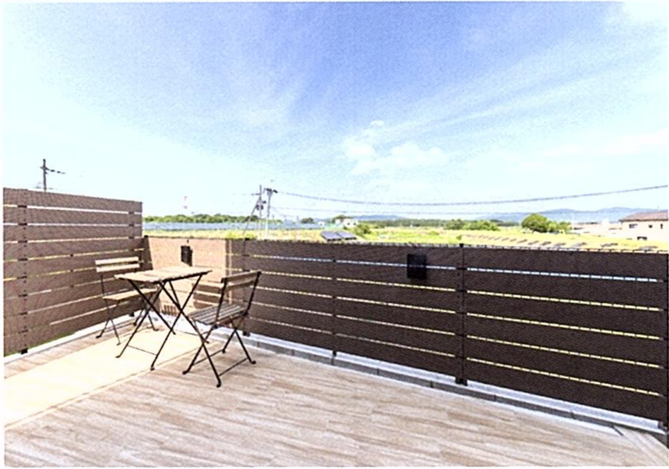
ウッドデッキに比べるとお手入れが手軽にできるタイルデッキ。視界一面に広がる空の下で、バーベキューを楽しむことも。