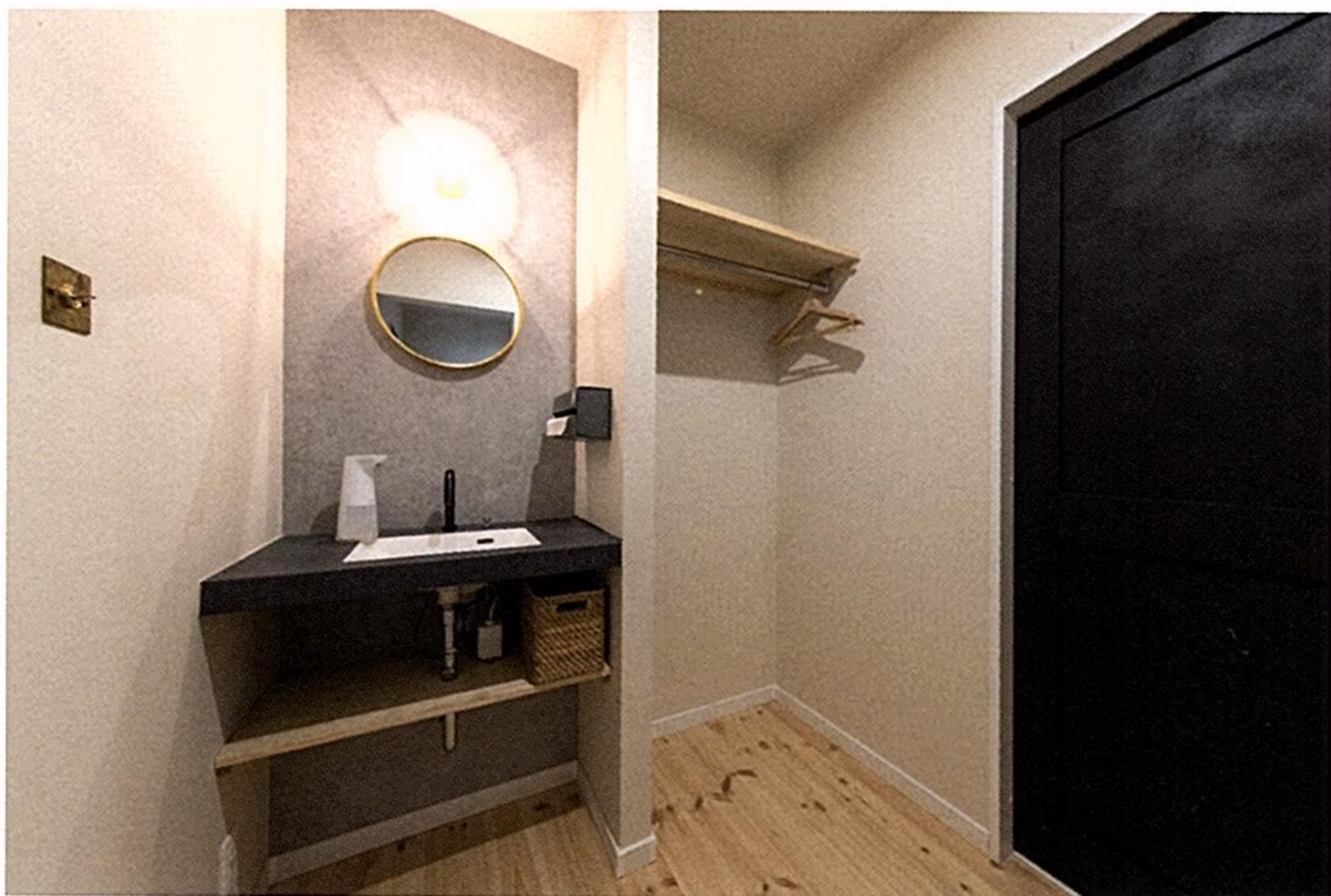
玄関ホールには、帰宅してすぐ手洗いができるよう洗面台を設置。隣のクロークには、外出時に使う上着やバッグなどを。右はトイレ。