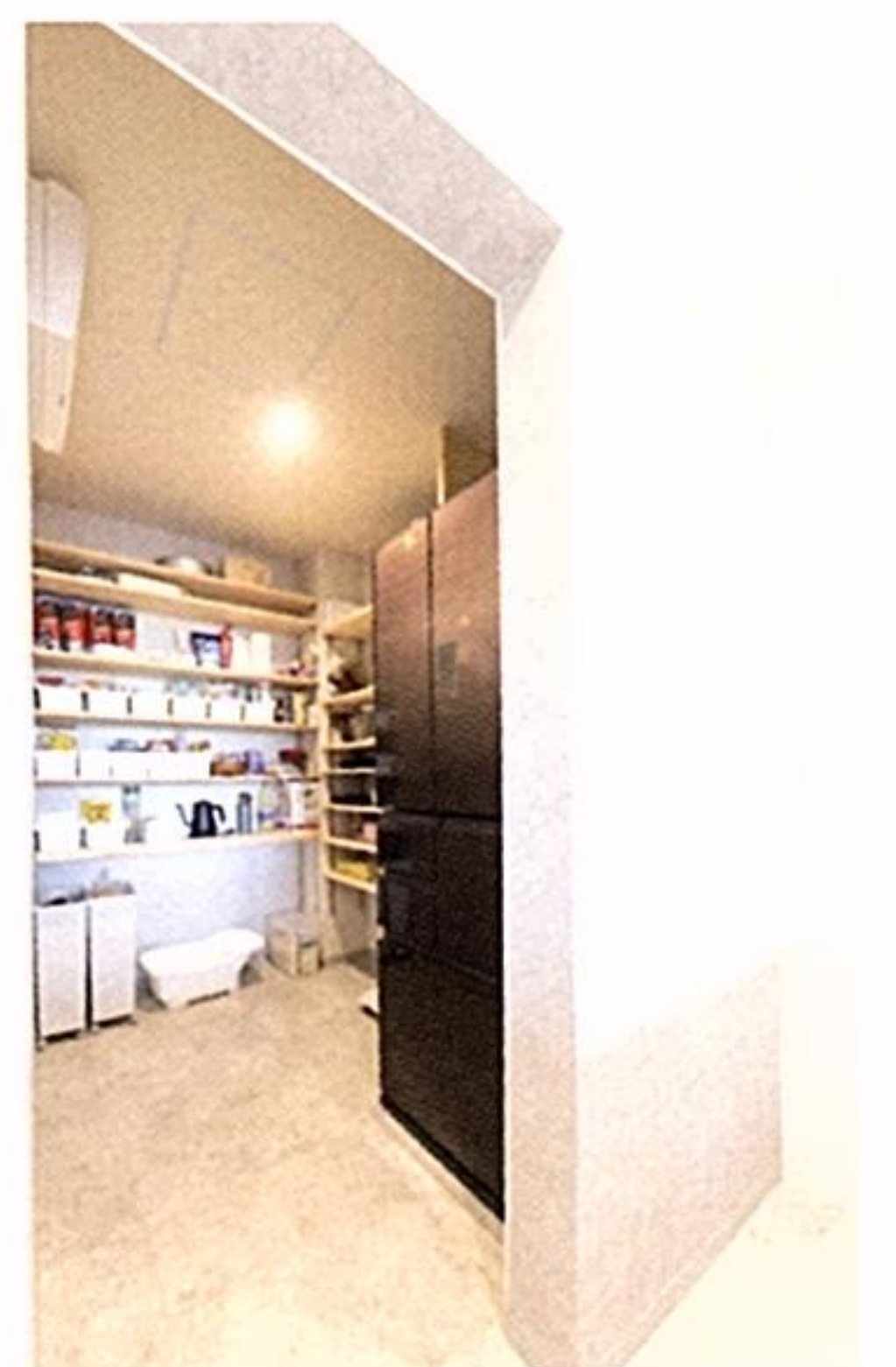
キッチンの背後には奥行きが広いパントリー。冷蔵庫をここに配置したことで、キッチンをよりすっきり見せることができている。

ありました。自分の子どもにも、身体に優しい健康な家に住んでほしいという思いから、お願いすることに決めました」と奥様。リビングや2階の個室など、水まわり以外の床はすべて、足裏に優しいパイン材を使用。夏はさらっと涼しく、冬はふんわりと温かさが伝わってきます。壁や天井は、素材自体が呼吸する珪藻土クロスを使用しました。構造材には、同じ気候風土で育った京都産の無垢材が使われているので、調湿性や脱臭性に優れ、長持ちします。 また、自分たちの生活リズムに合わせて、自由度の高い間取りを決めることができるのも、魅力の一つだったと言います。「大きな吹き抜けの空間を中心に、家のどこにいてもお互いの気配が感じられる、一体感のある家にしたかった」と話すご夫妻。家族が集う1階と、個室が並ぶ2階ホールをリビング階段で結び、「離れていても、気軽に声が掛け合える距離感に満足しています」と、奥様もうれしそうです。また、浴室や洗面室など水まわりの家事動線を2階にまとめたことで、1階のリビングを、大きなホールのように広くすることが可能になりました。 ライフスタイルの変化にもフレキシブルに対応できるよう、リビングや2階のホールなどの広い空間は、造り付けの棚や装飾はあえて入れずシンプルな空間に。「2階のホールは、いつかはソファなどを置いて、寝室に行く前に家族がくつろぐスペースになったらいいなと思っています」とご主人。将来も見据えて、これから先を楽しむ余白も残した、包容力のある理想の我が家が完成しました。